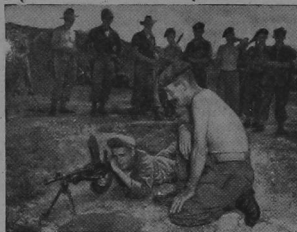
U. S. SOLDIER HANDLESS BREN GUN

British troops fighting alongside Americans in the United Nations land force in Korea have come into close contact with each other in the past few months. In the lulls between the sporadic fighting units get a chance to meet up with their comrades in arms.